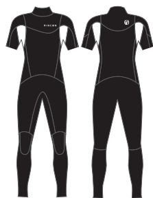
3/2mm Seagull 62,700yen (税抜価格57,000yen)