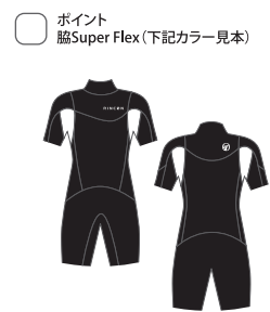
3/2mm S/S Spring 48,400yen (税抜価格44,000yen)

OPTIONS : ■下半身を4Way Flexに変更した場合 FULL、Seagull 6600yen (税込) UP、L/SP、S/SP 4400yen (税込) UP ■フルオーダー ¥0 ■ポイント GPFへ変更 3,300yen (税込) UP ■マーク追加 550yen (税込) UP