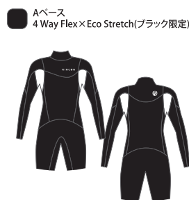
3/2mm L/S Spring 51,700yen (税抜価格47,000yen)